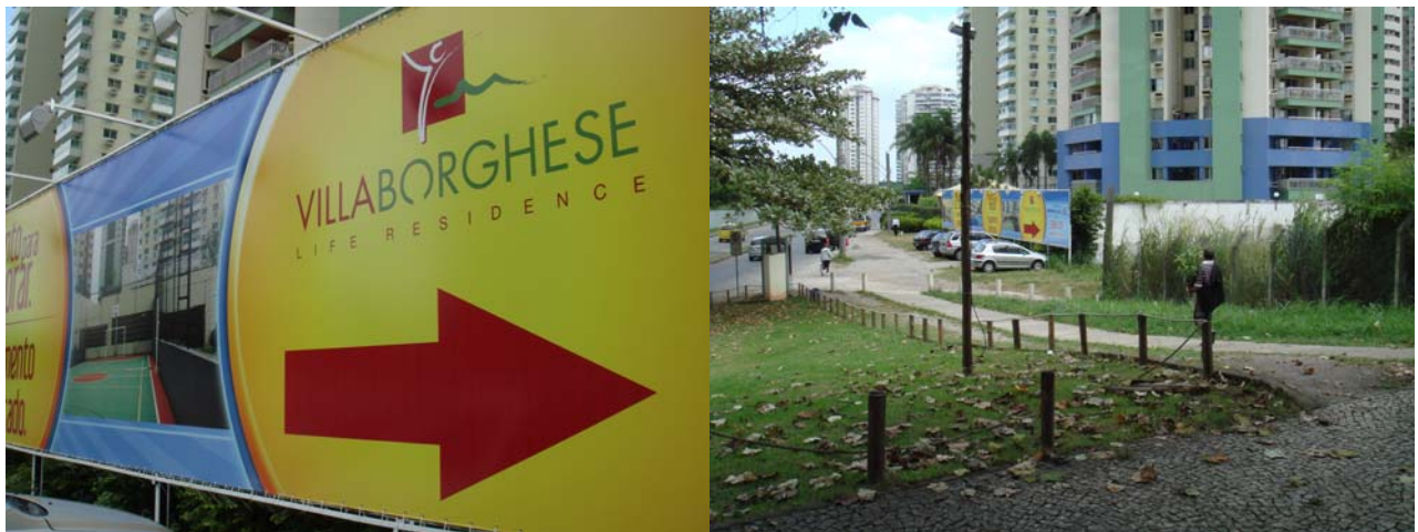
Foto cartaz e servidão de acesso ao stand de vendas