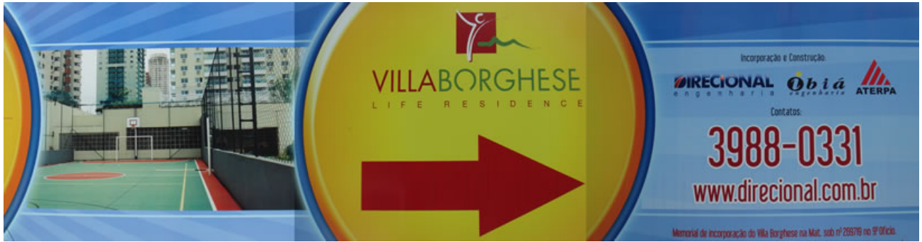
Foto cartaz com Quadra Poliesportiva e número de Memorial